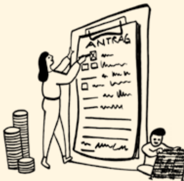
Tabelle). Von 1.396 € Nettoeinkommen werden deshalb nur 1.066 € für den Kinderzuschlagsanspruch von Finn berücksichtigt.

Annette steht insgesamt ein Freibetrag von 330 € zu. Ihr Einkommen ist mit 1.900 € brutto so hoch, dass sie sowohl vom Grundabsetzbetrag als auch von allen weiteren Freibeträgen auf Erwerbseinkommen profitieren kann (siehe